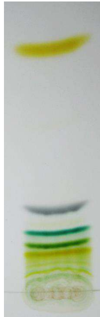
Abbildung 1 - DC-Platte nach 15 min in der Entwicklungskammer

Beobachtung: Das Filtrat hat eine dunkelgrüne Färbung, ähnlich der des Blattes. Auf der DC-Platte bilden sich nach 15 min. mehrere verschiedenfarbige Banden (siehe Abbildung 6).