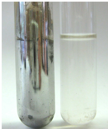
Abb. 8 - Tollensprobe bei Zugabe von Acetaldehyd (links) und Aceton (rechts).

Deutung: Ketone können weder durch die Fehling-Probe noch durch die Tollenz-Probe nachgewiesen werden, da sie im Gegensatz zu Aldehyden keine endständige Carbonylgruppe haben und somit aufgrund des fehlenden H-Atoms nicht partiell zur Carbonsäure oxidiert werden können. Daher können diese Nachweisreaktionen zur Unterscheidung von Aldehyden und Ketonen eingesetzt werden.