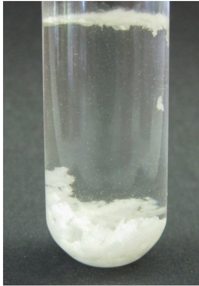
Abb. 9 - Bildung von Kristallen aus Aceton durch Zugabe von Natriumdisulfit.

Deutung: Natriumdisulfit addiert in einer nucleophilen Reaktion an Aceton und es bildet sich 2-Hydroxy-2-propansulfonsäure.