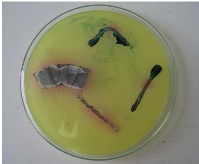
Abb. 3 – Beobachtung des Versuchs „V3“

Beobachtung: Der gerade Nagel weist an den Enden eine blaue Färbung auf, während sich der Bereich in der Mitte rot färbt. Der gebogene Nagel hat ebenfalls blaue Bereiche an den Enden, aber auch im Bereich des Knicks. Der Bereich des Nagels, der mit dem Kupferdraht umwickelt und mit Zinkblech verbunden ist, ist komplett rot gefärbt. Auch um das Kupferblech entstehen eine rote Färbung und zusätzlich eine weiße Ablagerung.