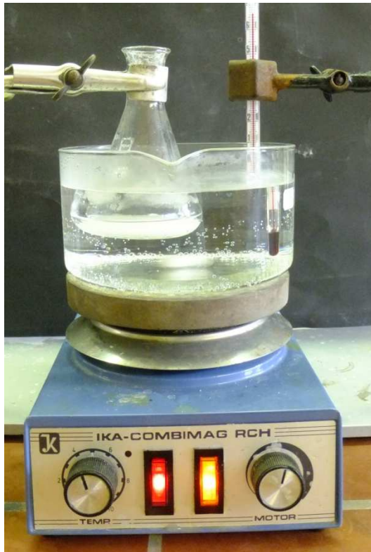
Abb 1: Herstellung von Aspirin®

Deutung: In der Reaktion A) wird Essigsäureanhydrid protoniert. In B) ist zu sehen, dass ein nucleophiler Angriff der Hydroxygruppe der Salicylsäure am Carbokation erfolgt. Dabei wird Essigsäure abgespalten. Im letzten Schritt wird ein Proton abgespalten und die Acetylierung ist abgeschlossen.