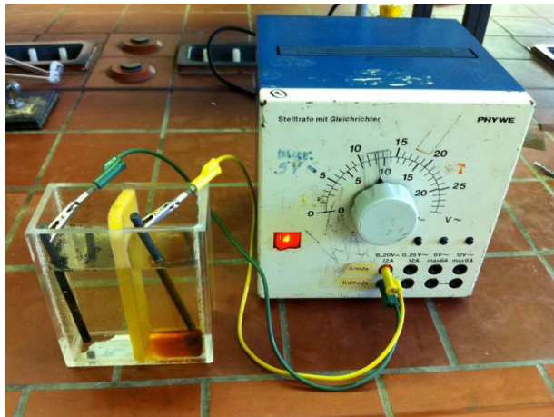
Abb. 2 – Zink-Iod-Batterie.

Deutung: Durch die Spannung von 10 V werden die Zink-Ionen reduziert und die Iodid-Ionen zu Iod oxidiert. Es handelt sich bei der Reaktion von Zink und Iod zu Zinkiodid um eine exotherme Redoxreaktion, die nach der Galvanisierung, mit Zink und Iod als Elektroden, eigenständig abläuft: