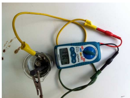
Abb. 3 – Das Leclanché Element.

Beobachtung: Das Voltmeter zeigt eine 1,36 V hohe Spannung an.