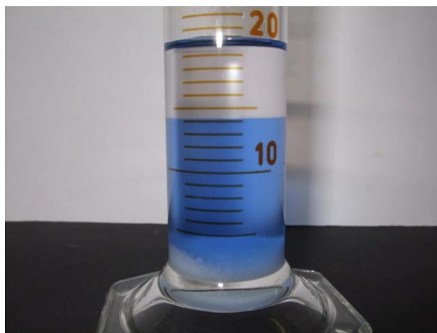
Abb. 6 - Aceton-Wasser nach der Zugabe von Salz (das Wasser wurde mit Tinte eingefärbt).

Beobachtung: Wasser und Aceton lösen sich ineinander, es entsteht eine klare Lösung. Beim Zugabe des Salzes kommt es zu einer Entmischung und es bilden sich zwei Phasen.