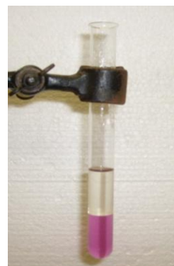
Abb. 3 - Toluol mit Baeyer-Reagenz.