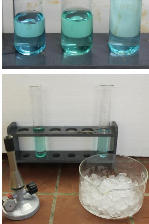
Abb. 2 - Ergebnisse von Versuchsteil a (oben) und Versuchsteil b (Tetrachlorokupfer(II)-Komplex (links) und Tetraaquakupfer(II)-Komplex (rechts))