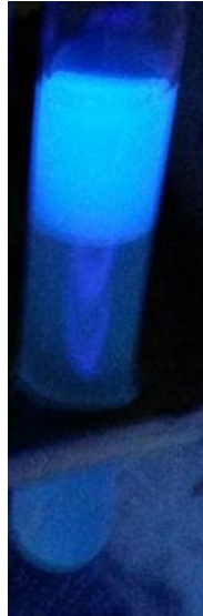
Abb. 1 - Fluoreszenz Thiochrom

Deutung: Das Vitamin B 1 wird im alkalischen Milieu durch Kaliumhexacyanoferrat(III)-Lösung zu Thiochrom oxidiert.