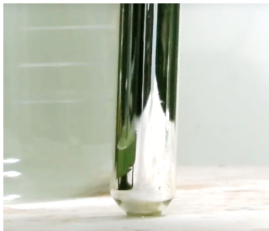
Abbildung 4: Der durch elementares Silber entstandene Silberspiegel ist der positive Nachweis für Aldehyde.

Wird Tollens-Reagenz zu der Lösung in Reagenzglas III gegeben, ist ebenfalls zunächst keine Veränderung zu beobachten. Beim Erhitzen der Probe im Wasserbad entsteht allerdings schnell ein dunkelbrauner bis schwarzer Niederschlag. Nach etwa 10 - 15 Minuten im Wasserbad kann beobachtet werden, dass sich ein Silberspiegel an der Innenwand des Reagenzglas gebildet hat.