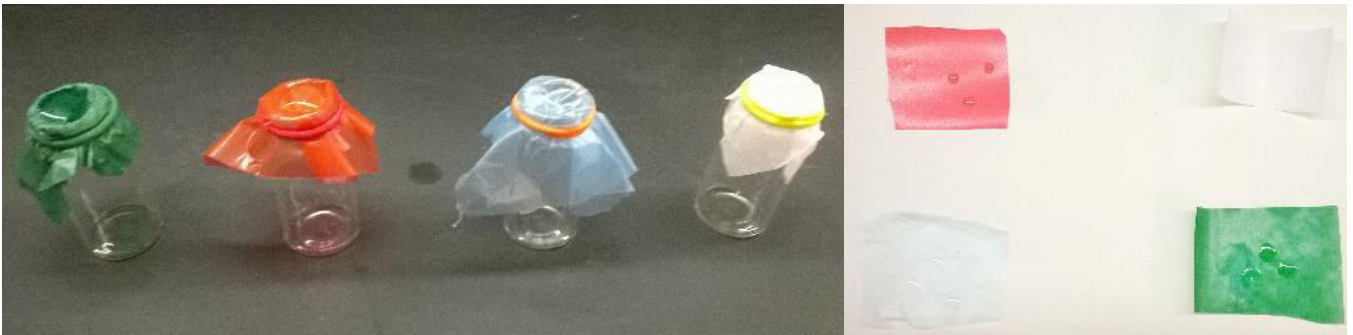
Abb. 4 - Versuchsaapparatur zur Erzeugung von Chlorwasserstoffgas.