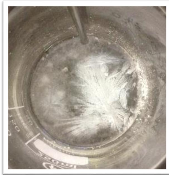
Abb. 2 - Kristallbildung des „Taschenwärmers“ im Reagenzglas.

Deutung: Das Natriumacetat-Trihydrat, das als Speichermedium dient, nimmt durch das Erhitzen mittels des Gasbrenners Wärme auf, was mit einer Aggregatzustandsänderung von fest nach flüssig einhergeht. Aufgrund des endothermen Reaktionsvorganges wird die Wärmeenergie als chemische Energie gespeichert. Nach Aktivierung kommt es wiederum zur Aggregatzustandsänderung von flüssig nach fest, sodass das Salz auskristallisiert.