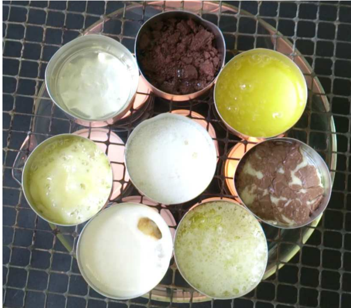
Abb. 7 – Beobachtung V3: Ergebnis nach 7 Minuten über den Flammen

Deutung: Alle Stoffe bis auf Salz schmelzen über der Kerzenflamme. Demnach haben alle Stoffe außer Salz eine niedrigere Schmelztemperatur als die Temperatur der Flamme. Die Stoffe, die zuerst schmelzen, haben die niedrigste Schmelztemperatur. Die Stoffe, die als letztes schmelzen, haben die höchste Schmelztemperatur von den Stoffen. Die ungefähre Reihenfolge der Schmelztemperaturen ist also Butter, Margarine < Käse < Wachs.