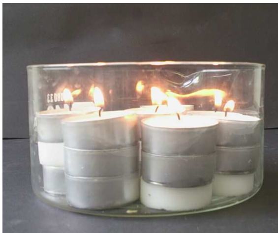
Abb. 5 – Versuchsaufbau V3: Aufbau zum Erhitzen der Proben

Zartbitterschokolade und Vollmilchschokolade bilden ebenfalls Blasen. Sie verändern sich rein äußerlich kaum, doch am Ende des Versuchs sind sie ganz weich und von unten etwas verbrannt. Beim Salz ist keine Veränderung zu beobachten.