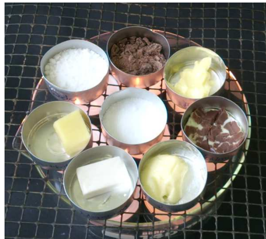
Abb. 6 – Beobachtung V3: Proben zu Beginn des Versuchs