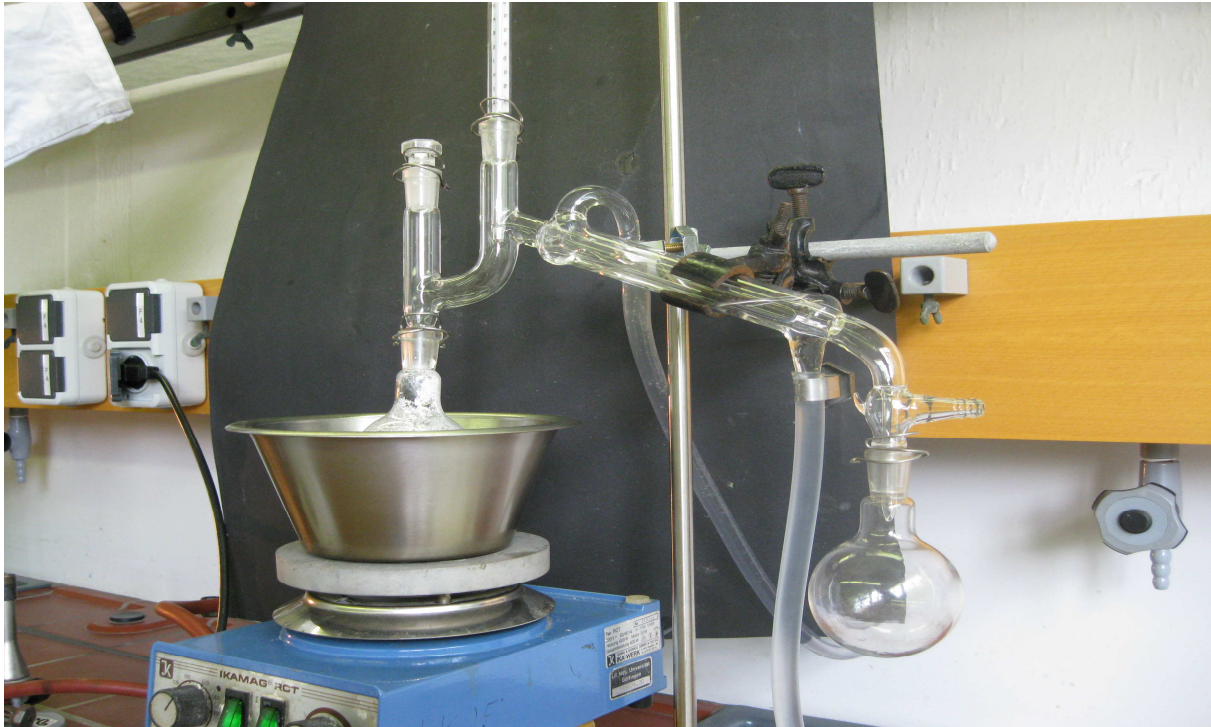
Abbildung 1: Aufbau der Destillationsapparatur

Beobachtung 2: Nach vollständiger Destillation befindet sich eine kristalline Substanz im ersten Rundkolben, während sich im zweiten Rundkolben eine farblose Flüssigkeit sammelt.