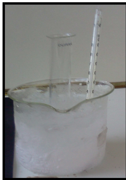
Abb. 4 – Versuchsaufbau „Frostaufbruch“

Chemikalien: Wasser, Eis, Natriumchlorid