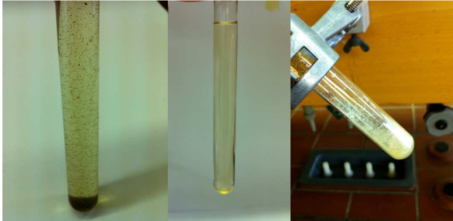
Abb. 2 – Links: Pfeffer und Salz im Reagenzglas mit Wasser. Mitte: Das Filtrat. Rechts: Produkt nach dem Eindampfen.

Deutung: Kochsalz lässt sich gut in Wasser lösen. Aus diesem Grund befindet sich kein festes Salz im Extrakt. Pfeffer hingegen löst sich nicht in Wasser und bleibt somit im Filter zurück. Das ist an der Klarheit des Filtrats zu erkennen. Beim Erwärmen mit dem Bunsenbrenner verdampft das Wasser und nur das zuvor gelöste Kochsalz bleibt zurück und lässt sich direkt wieder lösen.