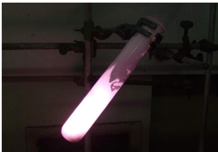
Abb. 1 – Verbrennung des Gummibärchens

Beobachtung: Es kommt sofort zu einer heftigen Reaktion. Ein brummendes Geräusch ist zu hören und es leuchtet rot im Reagenzglas. Eine starke Gasentwicklung ist zu beobachten.