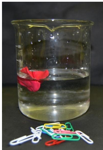
Abb. 9 - Versuchsaufbau „Bootsbau“

Durchführung: Das Becherglas wird mit 300 ml befüllt. Aus der Knetmasse wird ein schwimmfähiges Boot geformt und vorsichtig in das Wasser gesetzt. Nun wird das Boot mit so vielen Büroklammern beladen, bis es im Wasser sinkt.