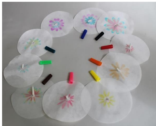
Abbildung 1 Musterbeispiele für die Papierchromatographie von Filzstiften

Beobachtung: Das Wasser steigt über den Docht in das Filterpapier und breitet sich gleichmäßig aus. Es wird ein Farbverlauf sichtbar, der in der Mitte bei schwarz beginnt in violett übergeht und über gelb und blau endet.