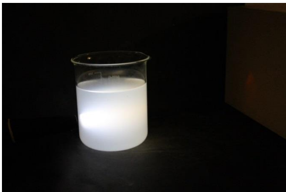
Abbildung 1 Modellexperiment zum Tyndall-Effekt (links: Das milchige Wasser erscheint blau; rechts: Projektion des roten Punkts.)

Beobachtung: Auf der Seite von der Taschenlampe sieht das milchige Wasser blau aus. Auf der gegenüberliegenden Seite sieht das milchige Wasser rot aus