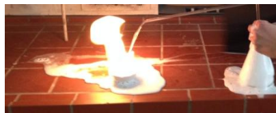
Abb. 1 – Erlischen eines Teelichts in CO 2 -Atmosphäre.

Beobachtung: Im Erlenmeyerkolben kommt es zur Gasentwicklung. Aus der Öffnung des Steigrohrs dringen kleine Bläschen aus, die den Ethanolbrand löschen.