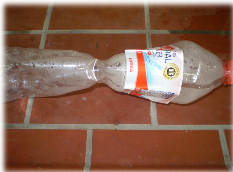
Abb. 3 - Durch Auswirkung des Luftdrucks eingedrückte Flasche

Beobachtung: Nachdem das Wasser ausgegossen wurde und die Flasche wieder verschlossen, zieht sich das Plastik zusammen.