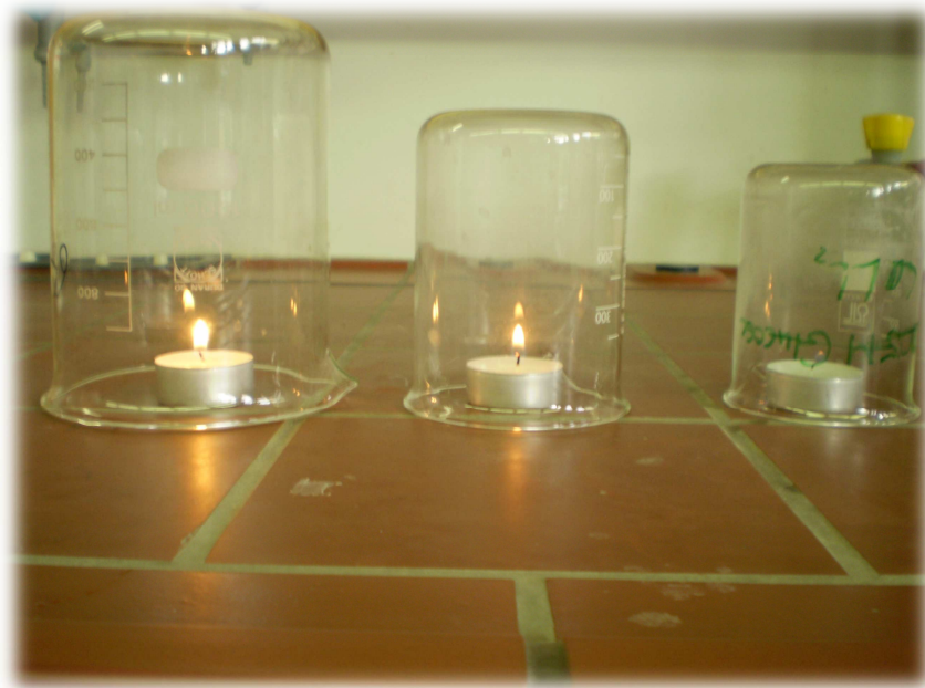
Abb. 5: Drei Teelichter unter unterschiedlich großen Bechergläsern