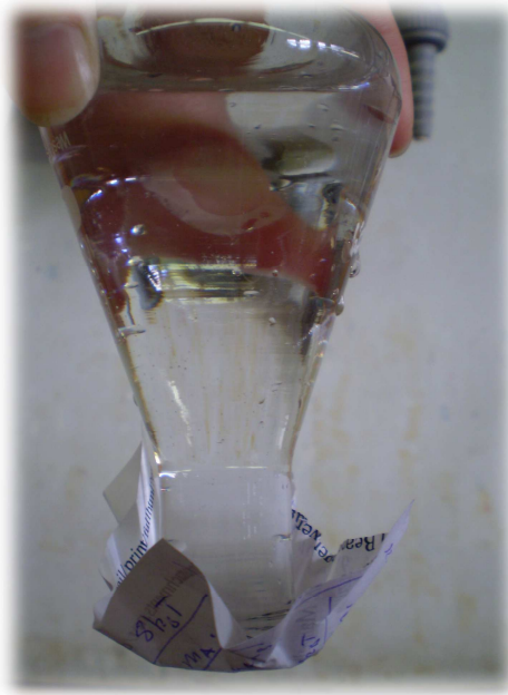
Abb. 2 - Mit Wasser gefüllter Erlenmeyerkolben auf den Kopf gedreht

Beobachtung: Das Wasser bleibt im Glas und läuft nicht aus.