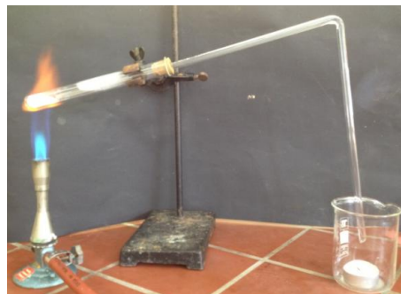
Abb. 6 – Erlischen eines Teelichts mit CO 2 .

Beobachtung: Die Flamme des Teelichts erlischt, nachdem sich ausreichend Gas im Reagenzglas gebildet hat und bis zum Becherglas vorgedrungen ist.