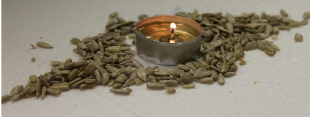
Abb. 1 - Das Sonnenblumenöl-Teelicht.