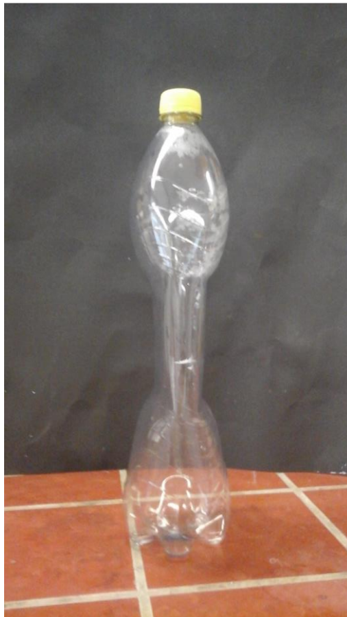
Abb. 3: PET-Flasche nach dem Versuch V3

Beobachtung: Einige Sekunden nach dem die Flasche verschlossen wurde beginnt sie sich zu verformen und wird zusammengedrückt.