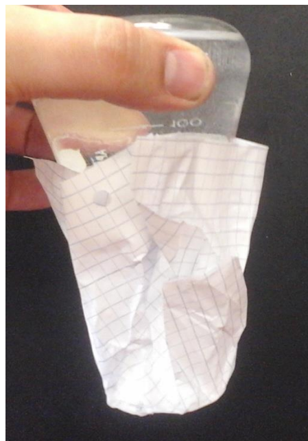
Abb. 1: Das Wasser bleibt im Kolben obwohl die Öffnung nach unten zeigt.

Beobachtung: Das Wasser verbleibt im Trinkglas obwohl das Glas mit der Öffnung nach unten gehalten wird.