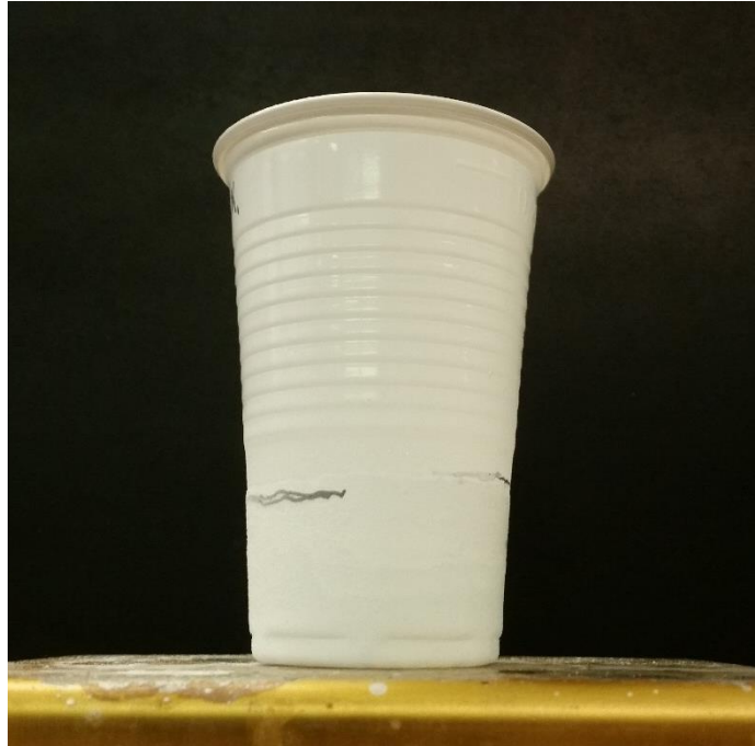
Abbildung 1: Becher mit gefrorenem Wasser. Der rechte, etwas höher gelegene Strich markiert die Füllhöhe des Eises nach dem Gefrieren, der rechte untere Strich markiert die Füllhöhe des flüssigen Wassers.

Deutung 1: Im festen Zustand ordnen sich die Wasserteilchen so an, dass kleine Zwischenräume zwischen ihnen bestehen bleiben. Daher hat gefrorenes Wasser ein größeres Volumen als flüssiges Wasser