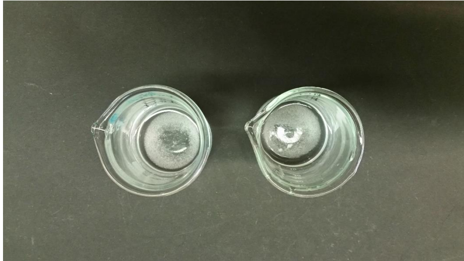
Abbildung 1: Bechergläser nach Zugabe von zwei Spateln Substanz. Links: Kaliumchlorid, rechts: Natriumchlorid.