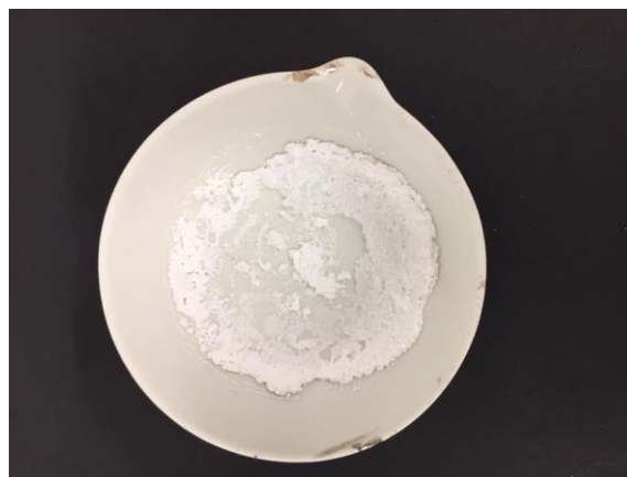
Abb. 1 – Abdampfschale mit weißem Salzrückstand.

Nach dem Erhitzen der Kochsalzlösung, beginnt diese zu sieden und das Wasser verdampft. In der Schale verbleibt ein weißer Rückstand zurück.