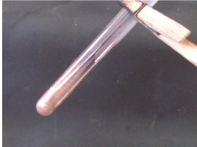
Abb. 12 – Nach dem Erhitzen: rot-goldenes, elementares Kupfer

Deutung: Eine Sauerstoffübertragungsreaktion hat stattgefunden. Die Farbveränderung von rot zu rot-golden weist darauf hin, dass Kupfer entstanden ist.