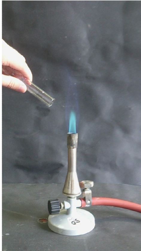
Abb. 13 - Versuchsaufbau des Versuchs „Knallgas“

Deutung: Bei Reagenzglas a) wird Wasserstoff verbrannt, was zu dem aus dem Wasserstoffnachweis bekannten Geräusch führt. Das Geräusch von Reagenzglas c) ist anders. Das kommt daher, dass Wasserstoff mit Sauerstoff reagiert. Wasser entsteht (Flüssigkeitströpfchen). Die Reaktion findet unter einem lauten ‚Plopp‘ statt.