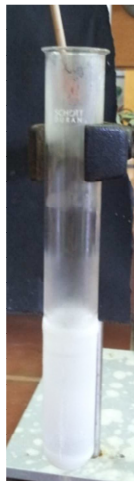
Abb. 2 – erlöschender Glimmspan