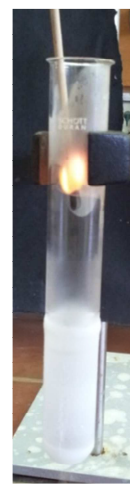
Abb. 3 – aufglühender Glimmspan