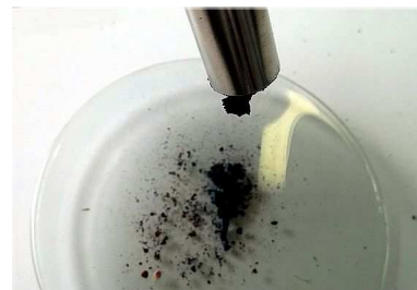
Abb. 2: Produkt des Hochofenprozesses

Deutung: Es laufen mehrere Reaktionen im Verbrennungsrohr ab. Durch den Sauerstoffmangel zu Beginn des Erhitzens erfolgt eine unvollständige Verbrennung ( C + O_2 \rightarrow CO_2 und CO_2 + C \rightarrow 2 CO ). Es entsteht Kohlenstoffmonoxid, das das Eisen(III)-oxid zu elementarem Eisen reduziert: