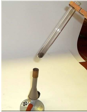
Abb. 5 : Versuchsaufbau „Reaktion von Kupferoxid und Eisen“