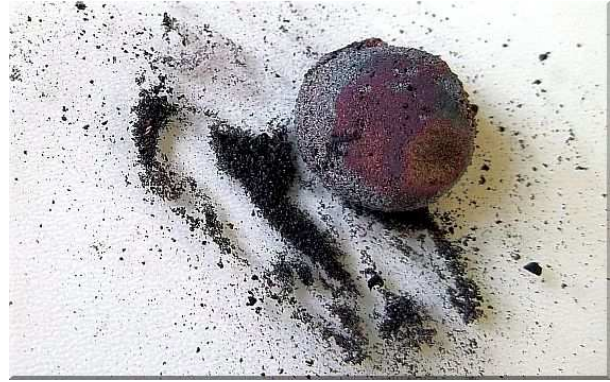
Abb. 6: Reaktionsprodukt (Eisenoxid mit Kupfer)

Deutung: Es findet eine exotherme Reaktion statt, da auch nach Entfernen des Bunsenbrenners ein Glühen zu beobachten war, dass sich im Reagenzglas weiter ausgebreitet hat. Es läuft folgende Reaktion ab: