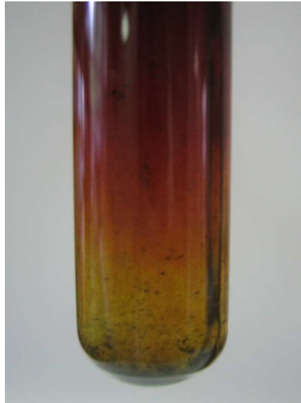
Abb. 1 - Deutung von Versuch „V1“: Iod fällt aus.

Deutung: Das Iodid wird bei dem Vorgang oxidiert und Wasserstoffperoxid reduziert. Die Gesamtreaktion lautet folgendermaßen: