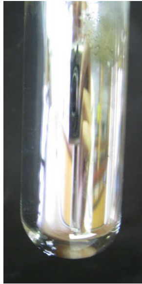
Abb. 2 – Deutung Versuch „V2“: Es entsteht ein Silberspiegel.

Deutung: Die gelösten Silber-Teilchen werden von der Glucose-Lösung reduziert und es fällt elementares Silber aus.