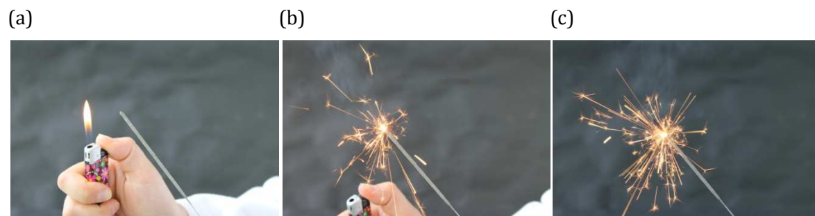
Abb 1: Die Wunderkerze vor (a), während (b) und nach dem Entzünden (c)