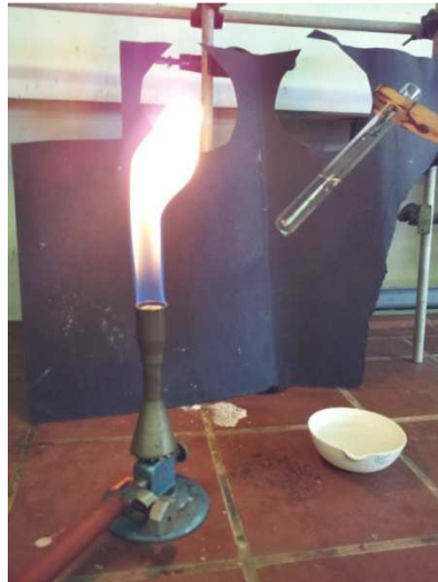
Abb. 4 - Aufbau Leuchtprobe.