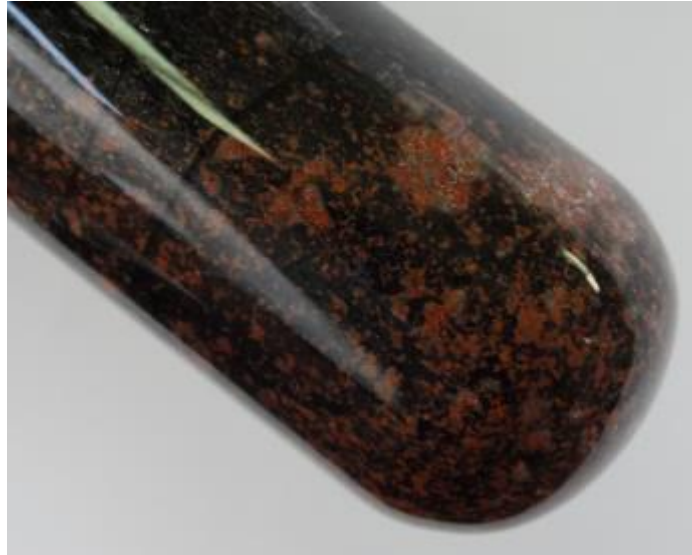
Abb. 1 – Elementares Kupfer.

Deutung: Bei der Reaktion von Magnesiumpulver mit Kupferoxid entstehen elementarer Kupfer und Magnesiumoxid. Das unedlere Magnesium wird dabei zu Magnesiumoxid oxidiert, während das Kupferoxid zu Kupfer reduziert wird.