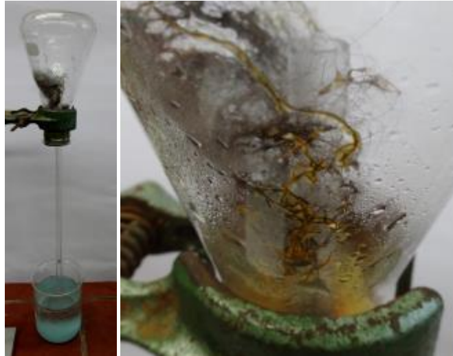
Abb. 1 – Versuchsaufbau (links) und die rostige Eisenwolle (rechts).

Deutung: Die noch feuchte Eisenwolle beginnt im Erlenmeyerkolben zu rosten. Dabei wird das Eisen vom Sauerstoff zu Eisenoxid (Rost) oxidiert. Der Sauerstoff wird dabei der Luft im Erlenmeyerkolben entzogen, wodurch ein Unterdruck entsteht welcher dafür sorgt, dass das Wasser im Glasrohr nach oben steigt.