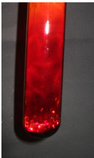
Abb. 1 – Alufolie in flüssigem Brom

Deutung: In einer heftigen Reaktion entsteht Aluminiumbromid.