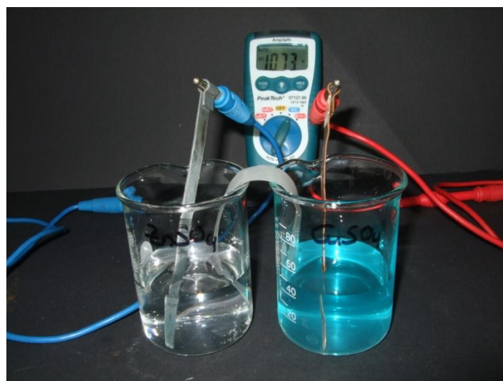
Abb. 3- Aufbau des Daniell-Elements

Beobachtung: Das Voltmeter zeigt eine Spannung von ungefähr 1 Volt an.