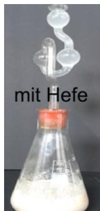
Abb. 11 – Kohlendioxidnachweis mit Kalkwasser beim Ansatz mit Hefe

Deutung: Im ersten Kolben katalysiert die Hefe den Abbau von Traubenzucker zu Alkohol (Ethanol) und Kohlendioxid. Dass es sich bei dem entstandenen Gas um Kohlenstoffdioxid handelt, kann durch die Kalkwasserprobe nachgewiesen werden: Kalkwasser färbt sich bei Anwesenheit von Kohlenstoffdioxid trüb-weiß.