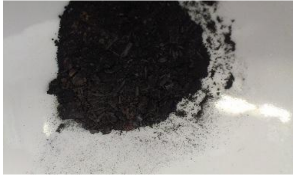
Abb. 7 - Reaktionsprodukte

Deutung: Kupferoxid wird durch das Eisen reduziert (rötliches Produkt) und das Eisen wird zu Eisenoxid oxidiert (schwarze Produkt):