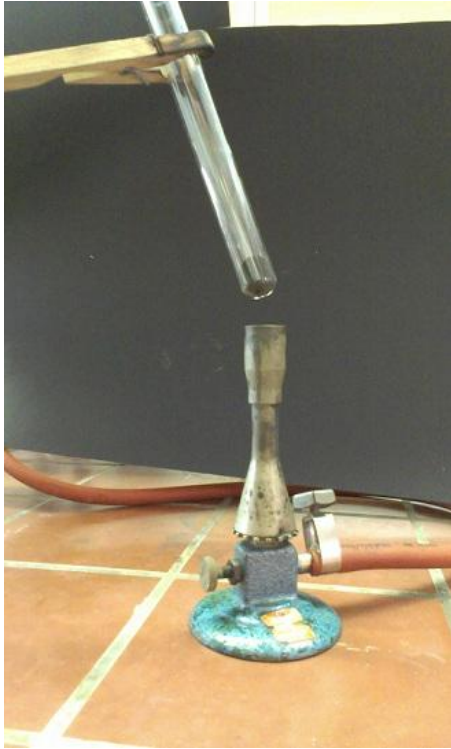
Abb. 6 - Versuchsaufbau