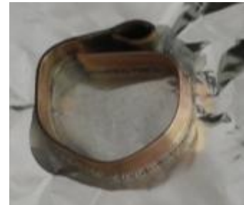
Abbildung 1: Kupferblech auf der Alufolie mit Natriumhydroxid.

Durchführung: Auf den beiden Pappkartons werden jeweils Aluminiumfolien ausgelegt. Anschließend werden sie mit Hilfe einer Pipette mit verdünnter Natronlauge benetzt. Auf eines der beiden Aluminiumfolien wird ein Kupferrohr gestellt. Das Kupferrohr wird nach etwa 20 Minuten entfernt.