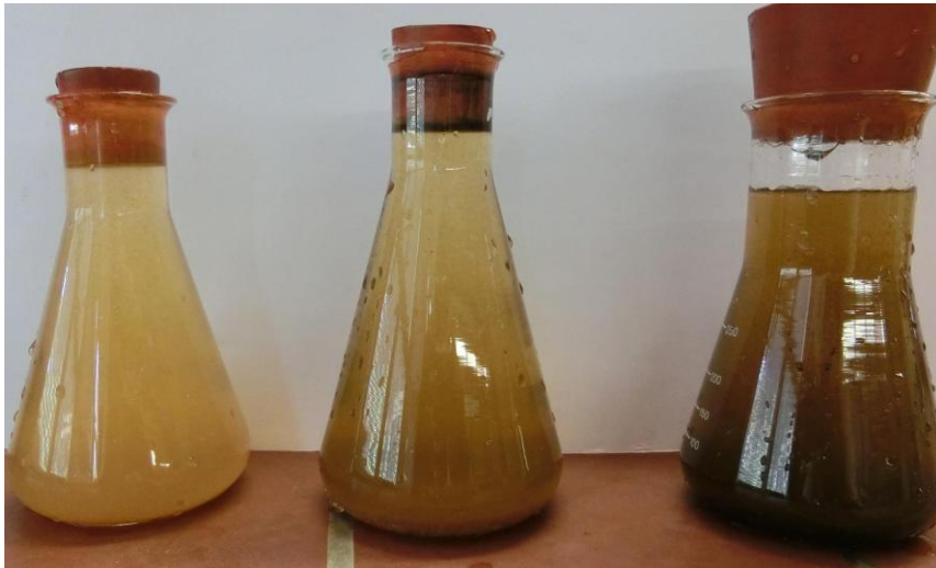
Abb. 1 - Nachweis von Sauerstoff in Wasser, links entgast, mitte unbehandelt, rechts begast

Beobachtung: In dem Kolben mit dem entgasten Wasser bildet sich nur wenig weißlich-durchsichtiger Niederschlag und die Lösung bleibt relativ hell. In dem Kolben mit dem unbehandelten Wasser bildet sich ein wenig dunkler Niederschlag, weshalb die ganze Lösung dunkler wirkt und in dem Kolben mit dem begasten Wasser bildet sich viel dunkler Niederschlag. Alle drei Kolben werden trüb.