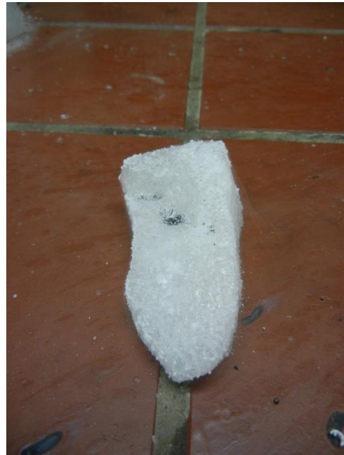
Abb. 2 Versuchsaufbau beim Entzünden des Magnesiumbands (links) und Trockeneisblock nach der Reaktion (rechts). In der Mulde ist eine schwarze Substanz zu erkennen.