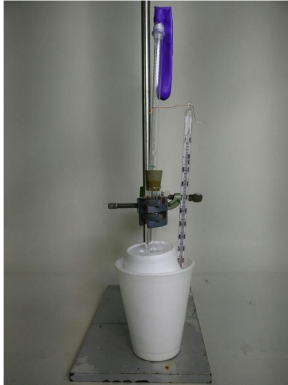
Abb. 3: Versuchsaufbau bestehend aus Kalorimeter, Thermometer und Luftballon, der mit 1-2 g Wasser gefüllt ist.

Beobachtung: Das weiße Kupfer(II)-sulfat hat sich blau verfärbt. Die Temperatur des Wassers steigt um 5 K.