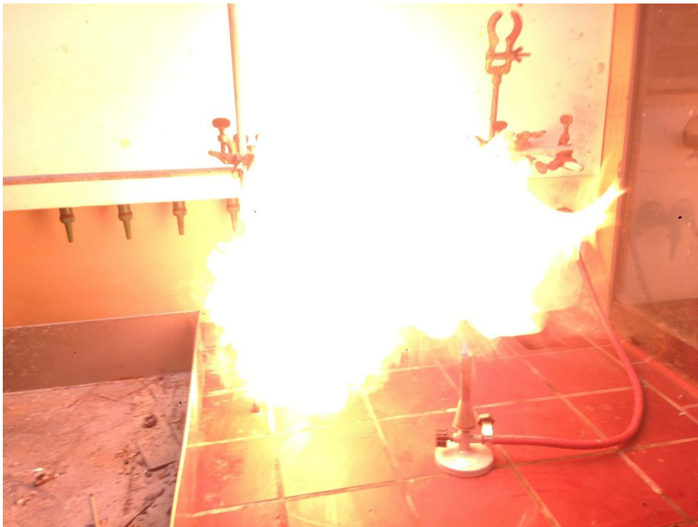
Abb. 1: Verbrennen von Bärlappsporen setzt schnell große Mengen chemischer Energie in Wärme, Licht- und kinetische Energie um.

Beobachtung: Die Bärlappsporen verbrennen unter plötzlicher Entwicklung einer heißen Flamme und mit hörbarem Zischen.