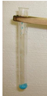
Abb. 5 - Kupfersulfat nach der Zugabe von Wasser.

Auswertung 1: Das blaue Kupfersulfat-Pentahydrat wird dehydriert, das heißt es wird Wasser entzogen. Es entsteht farbloses Kupfersulfat. Für die Reaktion wird Energie in Form von Wärme benötigt, da das Salz erhitzt werden muss. Es handelt sich also um eine endotherme Reaktion.