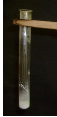
Abb. 3 - Kupfersulfat-Pentahydrat nach dem Erhitzen.

Beobachtung 2: Das weiße Pulver wird wieder blau (siehe Abb. 4 und Abb. 5). Der Reagenzglasboden wird heiß.