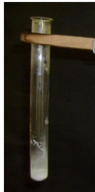
Abb. 4 - Kupfersulfat vor der Zugabe von Wasser.

Beobachtung 2: Das weiße Pulver wird wieder blau (siehe Abb. 4 und Abb. 5). Der Reagenzglasboden wird heiß.