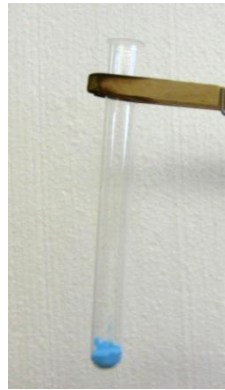
Abb. 2 - Blaues Kupfersulfat-Pentahydrat vor dem Erhitzen.

Beobachtung 1: Das blaue Kupfersulfat-Pentahydrat wird weiß. Am oberen Reagenzglasrand kondensiert eine Flüssigkeit bzw. Dampf entweicht (siehe Abb. 2 und Abb. 3).