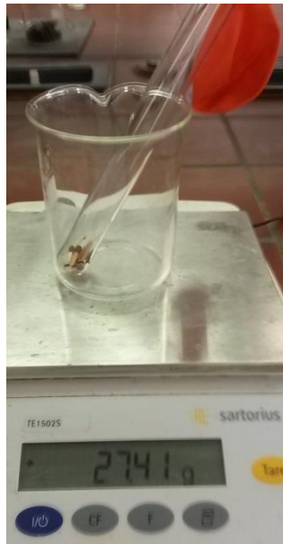
Abb. 1 - Gewicht vor der Reaktion.

Beobachtung: Die Streichhölzer entzünden sich und der Ballon bläht sich auf. Das Gewicht bleibt nahezu identisch.