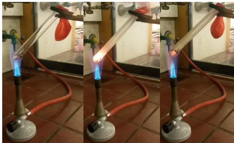
Abb. 2 - Der Luftballon bläht sich auf.

Beobachtung: Die Streichhölzer entzünden sich und der Ballon bläht sich auf. Das Gewicht bleibt nahezu identisch.