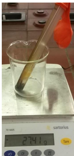
Abb. 3 - Gewicht nach der Reaktion.

Deutung: Bei diesem Versuch wird das Gesetz zur Erhaltung der Masse gezeigt. Abweichungen der Massen könnten darauf zurück zu führen sein, dass das System undicht war oder dass vor der Reaktion ein kaltes Duran Reagenzglas und nach der Reaktion ein warmes Duran Reagenzglas gewogen wurde.